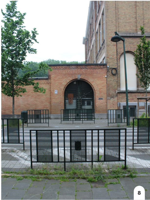
1 et 3. Trottoir côté Tivoli, 2 et 4. Trottoir côté écoles 5. Vue sur le jardin des Justes côté Tivoli, en face de l'école De Zenne 6. Entrée de l'école De Zenne 7. Rue de Molenbeek 8. Entrée de l'école Sainte-Ursule