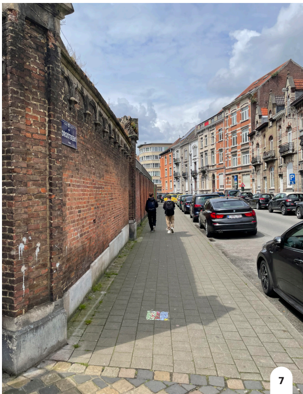
1. Placette depuis la rue Drootbeck 2. Placette depuis la rue de Wautier 3. Placette depuis la rue Yvonne Nèvejean 4 et 5. Station Villo et canisite sur la placette 6. Rue de Molenbeek 7. Rue Drotbeek